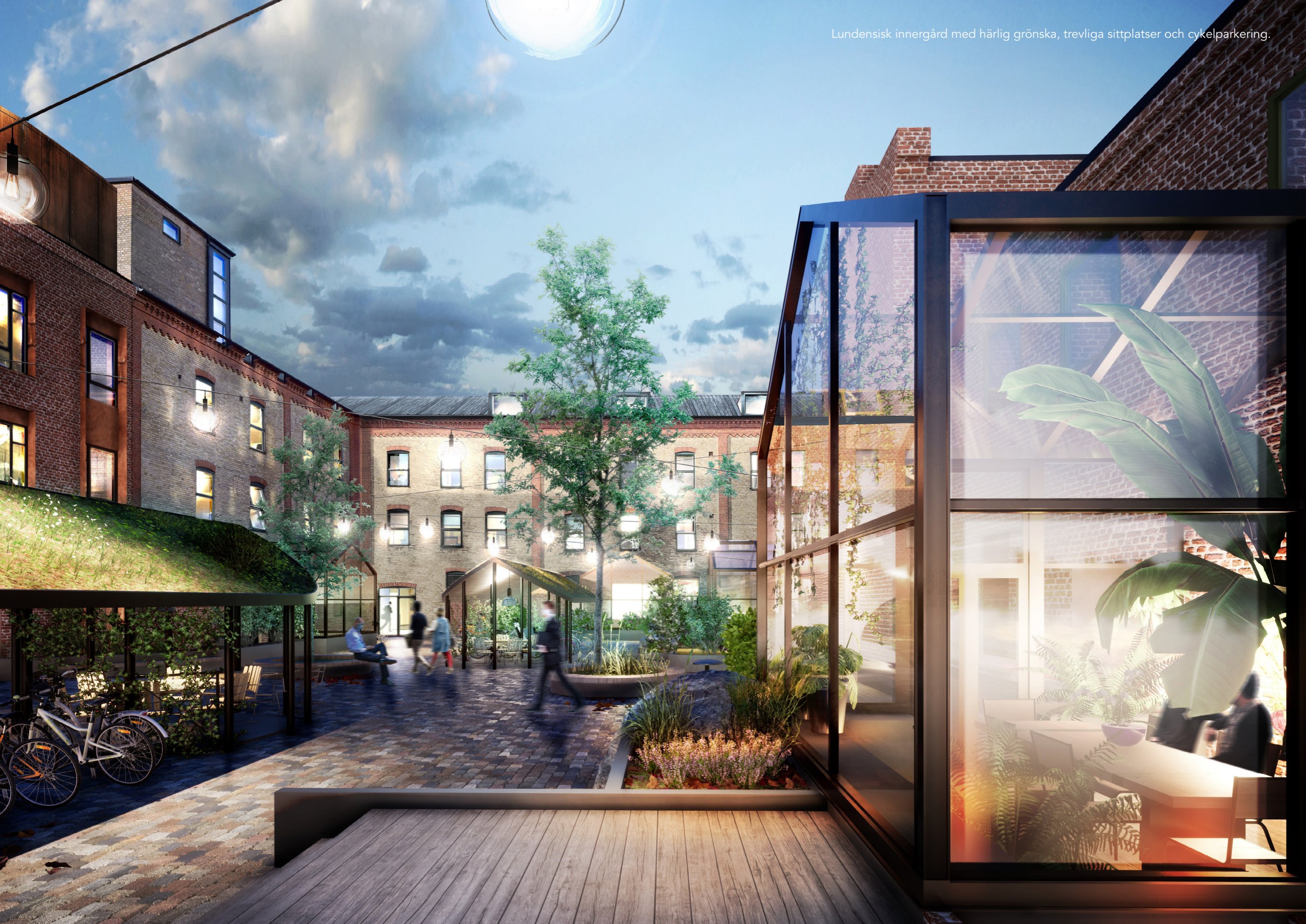
Lundensisk innergård med härlig grönska, trevliga sittplatser och cykelparkering.