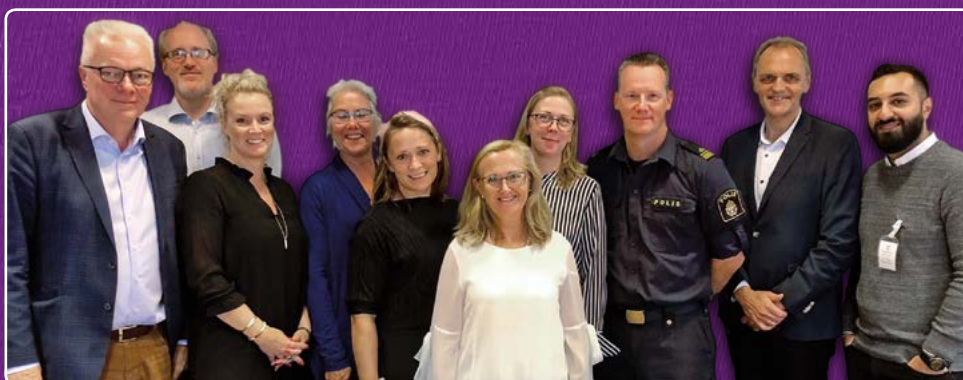
Samling inför den externa utvärderingen av Purple Flagområdet, med representanter från Helsingborgs stad, Helsingborg City, Polisen, fastighetsägare och näringsidkare.

helsingborg.se/purpleflag hbgvaxer.se hplus.se visithelsingborg.com helsingborgcity.se